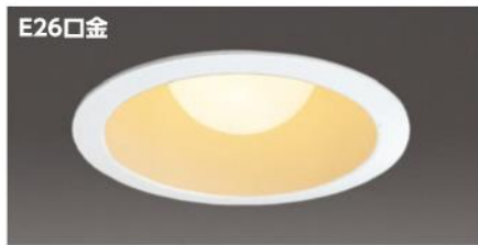
取付可能なタイプイメージ